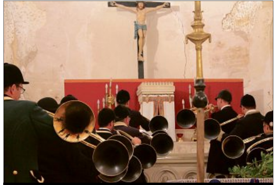
ÉGLISE. Seize sonneurs pour un premier concert donné avec succès au bénéfice de l'association.

Seize sonneurs des Amis des Bertranges ont ainsi donné le "la" et attiré un très nombreux public dans une église comble. Un bâtiment culturel édifié vers le XI e siècle, bien avant un autre édifice religieux qui