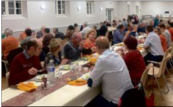
REPAS. Un moment très apprécié par des convives heureux de se retrouver.

L'ambiance était de mise, samedi soir, à la salle des fêtes. Une satisfaction pour le comité des fêtes, renouant ainsi avec sa tradition des repas de la saison d'hiver.