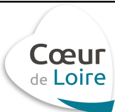
Tableau des allergènes du 06/02/23 au 10/02/23